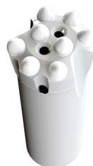
HTG 25R33M HTG 25R35M