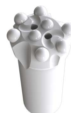
HTG 25R38M HTG 25R41M