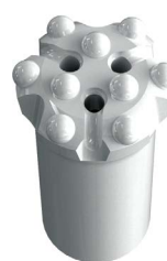
HTG 35R48S HTG 35R51S